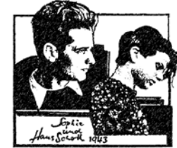
Sophie und Hans Scholl